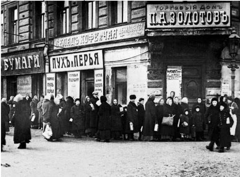
Рис. 1. Очередь за хлебом.