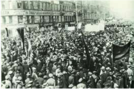
Рис. 5. Демонстрация в Петрограде, на которой выступил В. И. Ленин с призывом проведения мирной демонстрации под лозунгом «Вся власть Советам»

Фактическая власть (возможность влиять на ситуацию) была только у тех, кого готовы были слушать вооружённые массы солдат (в столице и на фронтах) и рабочих, захвативших оружие в столице. Уже с марта 1917 г. влияние на них могли оказывать только представители социалистических партий (эсеры, меньшевики, большевики), которые были избраны в общественные Советы рабочих, солдатских, а позднее и крестьянских депутатов уездов, губерний, столичных городов. Установилось двоевластие — формальная власть была у Временного правительства (из министров-«капиталистов» — членов либеральных партий), а реальная — у Советов (социалистические партии), которые, однако, стремились лишь контролировать действия Временного правительства до Учредительного собрания. Это двоевластие с апреля по сентябрь порождало кризисы во Временном правительстве и вело к смене его партийного состава. С каждым разом доверие к новой власти снижалось.