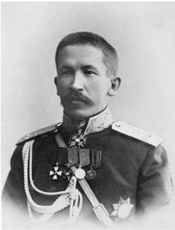
Рис. 6. Лавр Георгиевич Корнилов

В августе сторонники правой диктатуры провели в Москве Государственное совещание, где приветствовали главнокомандующего генерала Л. Г. Корнилова (рис. 6).