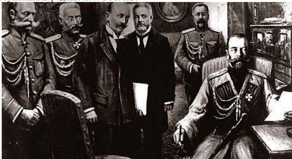
Рис. 2. Подписание отречения от престола Николая II

27 февраля — начало открытого перехода солдат запасных гвардейских полков на сторону восставшего народа. Начало «солдатского этапа» революции. Соединение рабочего и солдатского движений в Петрограде. Разгром восставшими рабочими и солдатами здания Окружного суда на Литейном проспекте. Освобождение ими подследственных, находившихся в Доме предварительного заключения. Активизация деятельности Государственной Думы, выдвинувшей политические требования Николаю II о смене правительства. Начало перехода на сторону Думы командующих фронтами (А. А. Брусилов, Н. В. Рузский). Непрерывное вовлечение в восстание против старой власти новых воинских подразделений. Превращение Таврического дворца в «штаб» революции. 28 февраля — начало выступлений народных масс в Москве